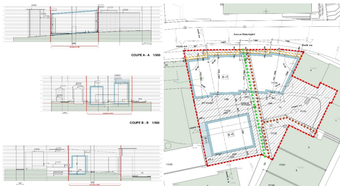
Plan réalisé par « artefact urbanisme » sàrl